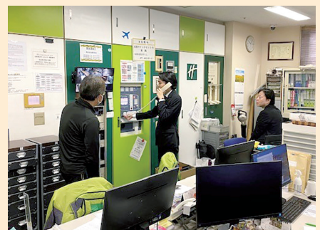
館内放送 / 119 通報