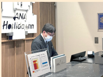
表示マーク掲示場所（フロント）